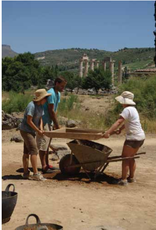
Fig. 1 Students from the 2011 UCB Archaeological Field School sift earth in the Hero Shrine

Here we go again.... just six months from now the 2012 Nemead will take place. The preparations are of course already underway and we look forward to welcoming the world to Nemea, just as we bring the past to the present. The Games will be center stage on the 23 rd of June but will be surrounded by activity on the archaeological site, reconstruction works on the Temple of Zeus and excavation in the Sanctuary, that we hope everyone will take the opportunity to visit.