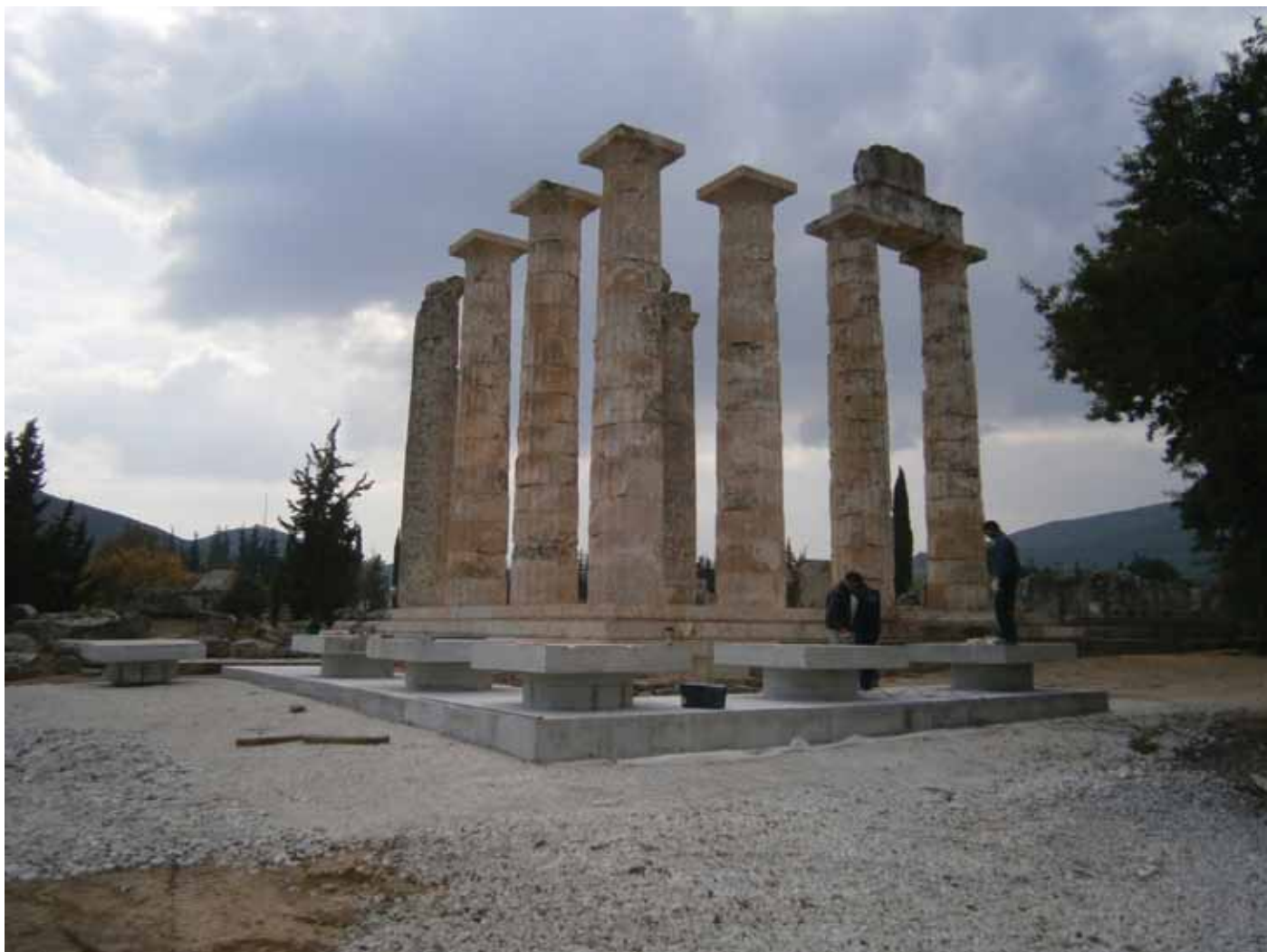
Εικόνα 2: Η ΒΑ γωνία του Ναού του Διός και η προσωρινή βάση για τη πειραματική ανακατασκευή των στοιχείων του θριγκού.